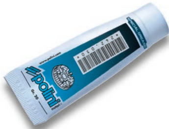
242.030 gr. 20

Special grease resistant to high temperatures; lithium and molybdenum disulphide addicted. It is specific for CVT variator. Solid lubricant able to firmly stick to lubricated surfaces and fill the microscopic holes.