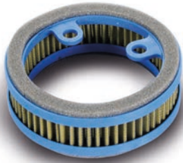
203.0149 TMAX 500 Variator filter - Filtra variatore